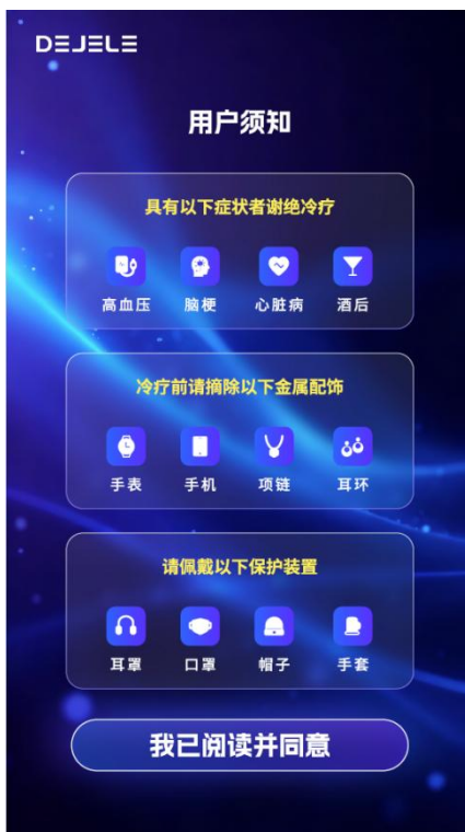
图 7：用户须知界面图