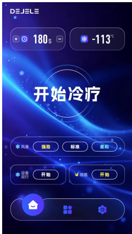
图 6：开始冷疗界面图