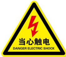
图 2：当心触电标贴图例