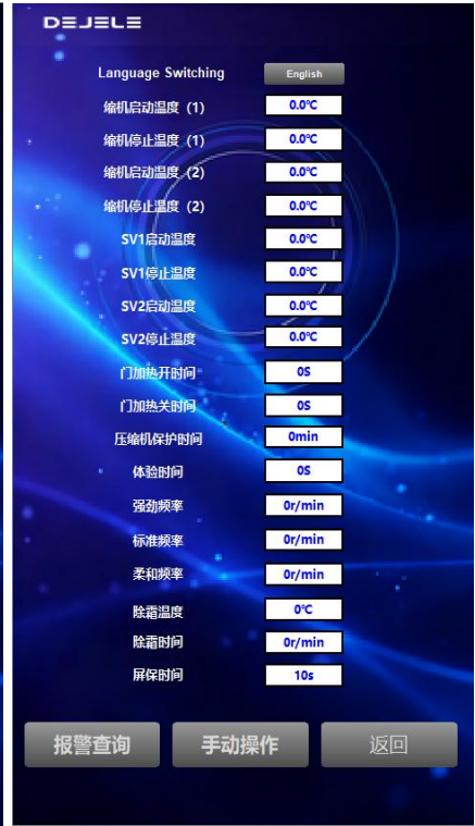
图 7: 管理设置界面图