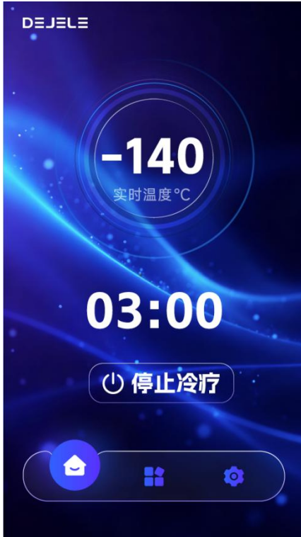
图 8：冷疗运行界面图