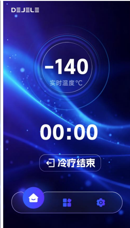
图 9：冷疗结束界面图