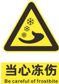
图 3：当心冻伤标贴图例